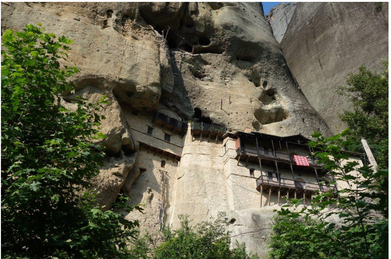
Die Einsiedlerhöhlen von Meteora - wo die ersten Mönche Einsamkeit über der Welt suchten

Die Einsiedlerhöhlen, an denen man auf dem Weg vorbeikommt, sind keine Ruinen. Mehrere waren bis ins frühe 20. Jahrhundert bewohnt. Einige enthalten noch Fragmente von Holzmöbeln, Strickleitern und Tongefässen.