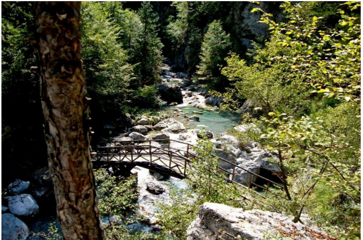
Die Enipeas-Schlucht, Olymp - türkisfarbenes Wasser unter alten Platanen

Der Berg war die Heimat der zwölf olympischen Götter. Beim Wandern hier, in der Stille des Hochwaldes, mit dem Ägäischen Meer weit unten durch das Kiefernkrondach sichtbar, versteht man leicht, warum die alten Griechen diesen Ort für ihr Pantheon wählten. Litochoro, das kleine Städtchen zu seinen Füßen, liegt wenige Minuten vom Meer entfernt - nach einem Tag am Berg ist die Ägäis da: ruhig, warm im späten September und ganz für sich allein.