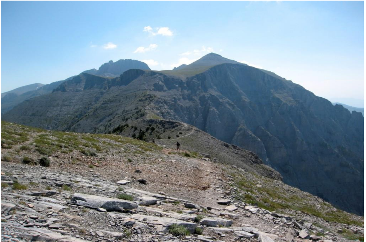
Der Olymp - mit 2.917 Metern der höchste Berg Griechenlands