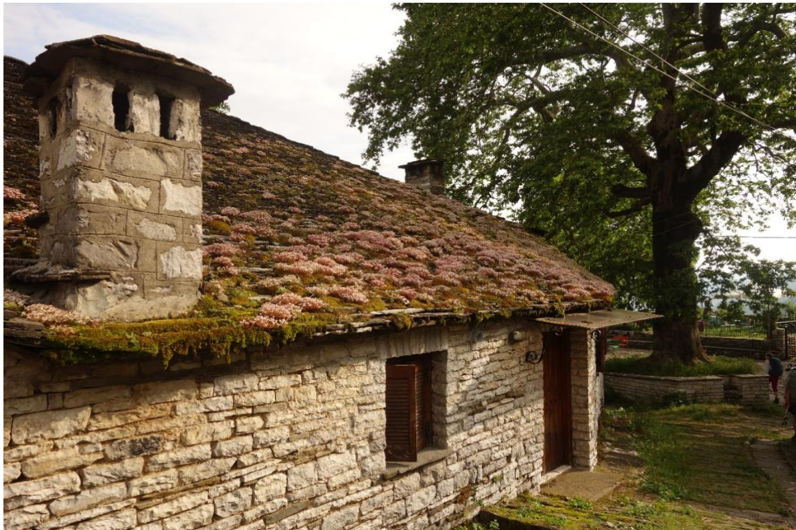
Traditionelles Steinhaus im Zagori

Übernachtung Unterkunft in der Region Meteora