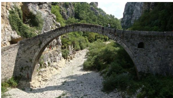
Die Kokkoros-Brücke, Zagori - ohne Mörtel gebaut, 18. Jahrhundert

Das Pindosgebirge, das Zagori rahmt, gehört zu den letzten grossen Rückzugsgebieten für Wildtiere in Europa. Braunbären und Wölfe streifen noch immer durch die Buchenwälder. Steinadler und Gänsegeier kreisen über den Schluchten. Im Herbst färben sich die Kastanienbäume goldgelb, wilder Salbei liegt in der Luft - und die Wege gehören fast ausschliesslich denen, die sie bewusst suchen.