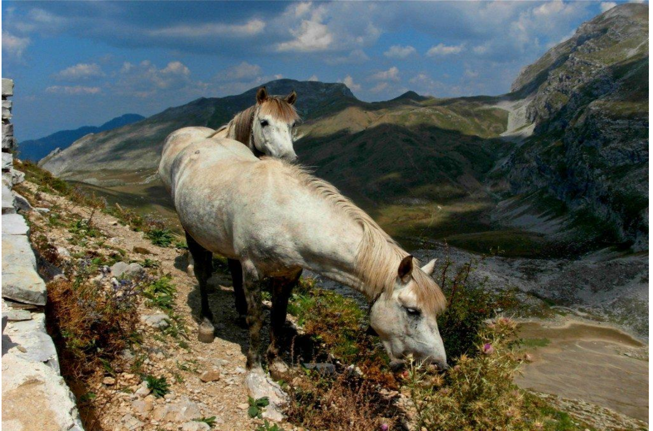
Wildpferde auf den Hochwiesen des Pindus