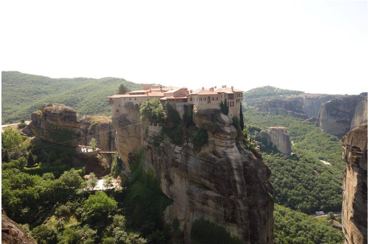
Die Felsformationen von Meteora - 60 Millionen Jahre Geologie, neun Jahrhunderte Klosterleben

Die ersten Einsiedlermönche kamen im 9. Jahrhundert, zogen sich an Seilen und Leitern hoch, um über der Welt Einsamkeit zu suchen. Bis zum 14. Jahrhundert krönten 24 Klöster die Gipfel. Heute sind noch sechs aktiv, ihre Fresken, Bibliotheken und Klosterküchen weitgehend unverändert seit der byzantinischen Zeit.