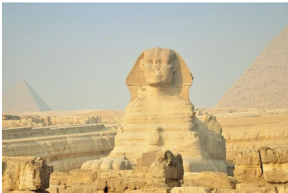
Grosse Sphinx von Gizeh

Heute tauchen Sie zum ersten Mal ins alte Ägypten ein. Sie besichtigen die weltberühmten Pyramiden von Gizeh sowie die Sphinx und erkunden Memphis und Sakkara. Zum Abschluss bewundern Sie die riesige Statue von Ramses II. Oskar Kaelin führt Sie in die wichtigsten archäologischen Entdeckungen und in die spannende Geschichte der Pharao-Kulturen ein.