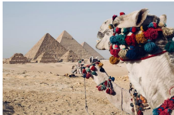
Pyramiden von Gizeh