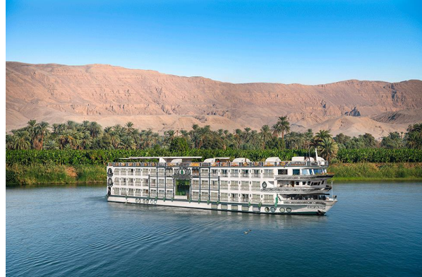
«Sonesta St. George»