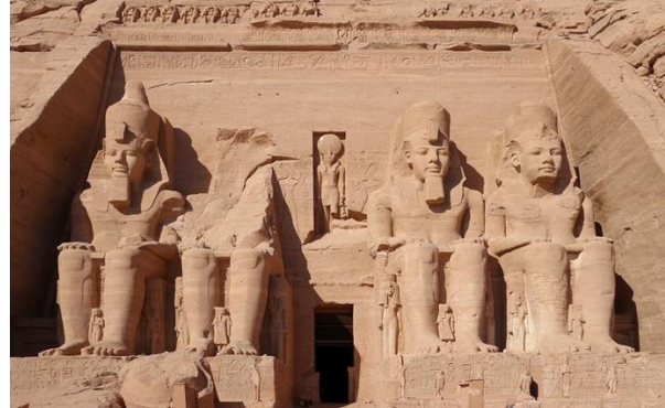
Tempel von Abu Simbel