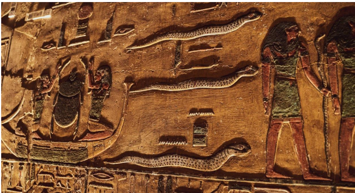
Tal der Könige